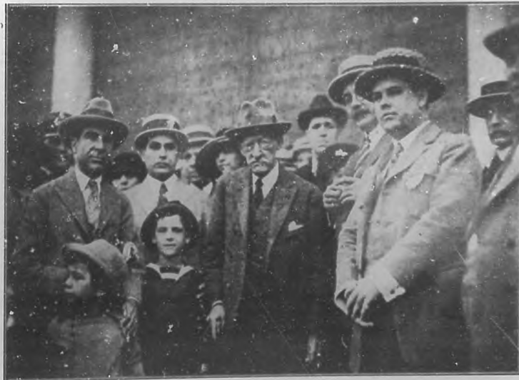
EL REGRESO DEL DR. FRANCISCO ZAYAS.— Personas que concurrieron a recibir al ilustre diplomático doctor Francisco Zayas a su regreso de París, donde con tanta brillantez representa a Cuba.

próximo lunes 26. Será a las cinco p. m. y en el Teatro "Principal de la Comedia", con el mismo programa que ya publicamos en el número anterior.